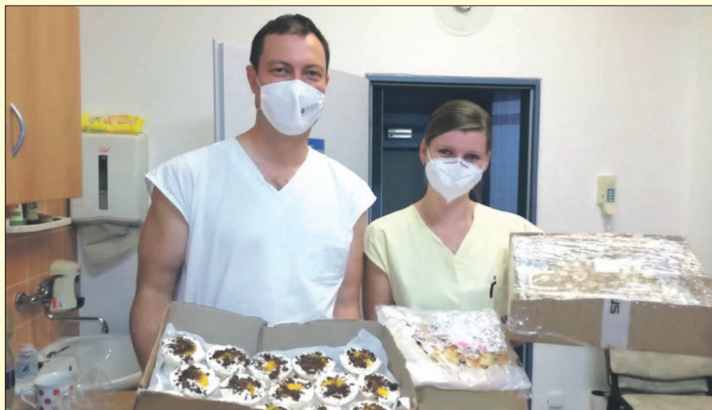
Po určitém tápání se objevila i nyní vlna solidarity se zdravotníky od soukromých dárců a firem. Ti v posledních dnech nemocnici zahrnuli nejrůznějšími potravinami, nápoji, drogerií a dalším. Na snímku jsou zdravotníci Nemocnice Pelhřimov z oddělení ARO, pro které pekly ženy z Myslůtina.

V minulých dnech byl okres Pelhřimov uváděn jako nejvíce zasažený nákazou koronavirem. Podle zveřejněného přepočtu nakažených na sto tisíc obyvatel u nás přibýlo během prvních listopadových dnů za týden téměř 1200 nových případů. Podle hygieniků byla situace na Pelhřimovsku srovnatelná s ostatními okresy Vysočiny. Jedná se o statistický přepočet a náš okres je méně zalidněný, má přes sedmdesát tisíc obyvatel. Celkem se již v okrese nakazilo na 3700 lidí. Vyléčilo se pak zhruba 3400 nemocných koronavirem. Na Pelhřimovsku zemřelo s covidem k minulému týdnu 51 osob. Od 5. listopadu Nemocnice Pelhřimov z kapacitních důvodů neposkytuje lůžkovou hospitalizaci na dětském oddělení. K dispozici jsou lůžka na jiných odděleních. Pacienty by přijaly i okolní nemocnice. Začátkem listopadu hlásila pelhřimovská nemocnice, že je na hraně svých kapacit, co se týče intenzivní péče.